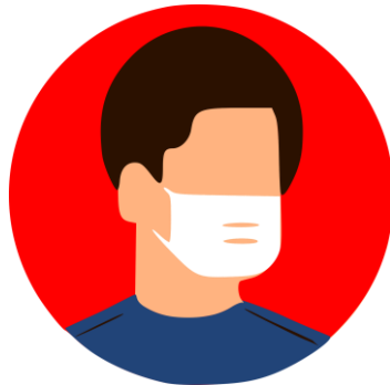
대면상담시 마스크 필수 착용