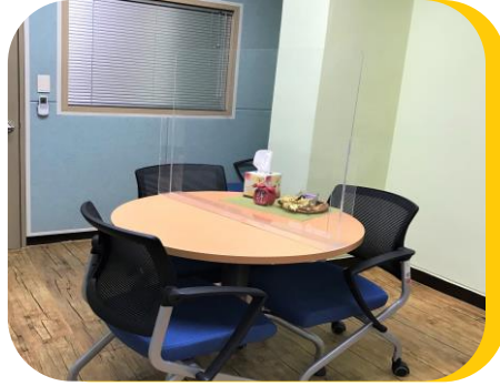
안전한 대면상담 위한 안전투명가림막 설치