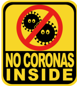
손소독제 비치 및 상담 전 발열체크